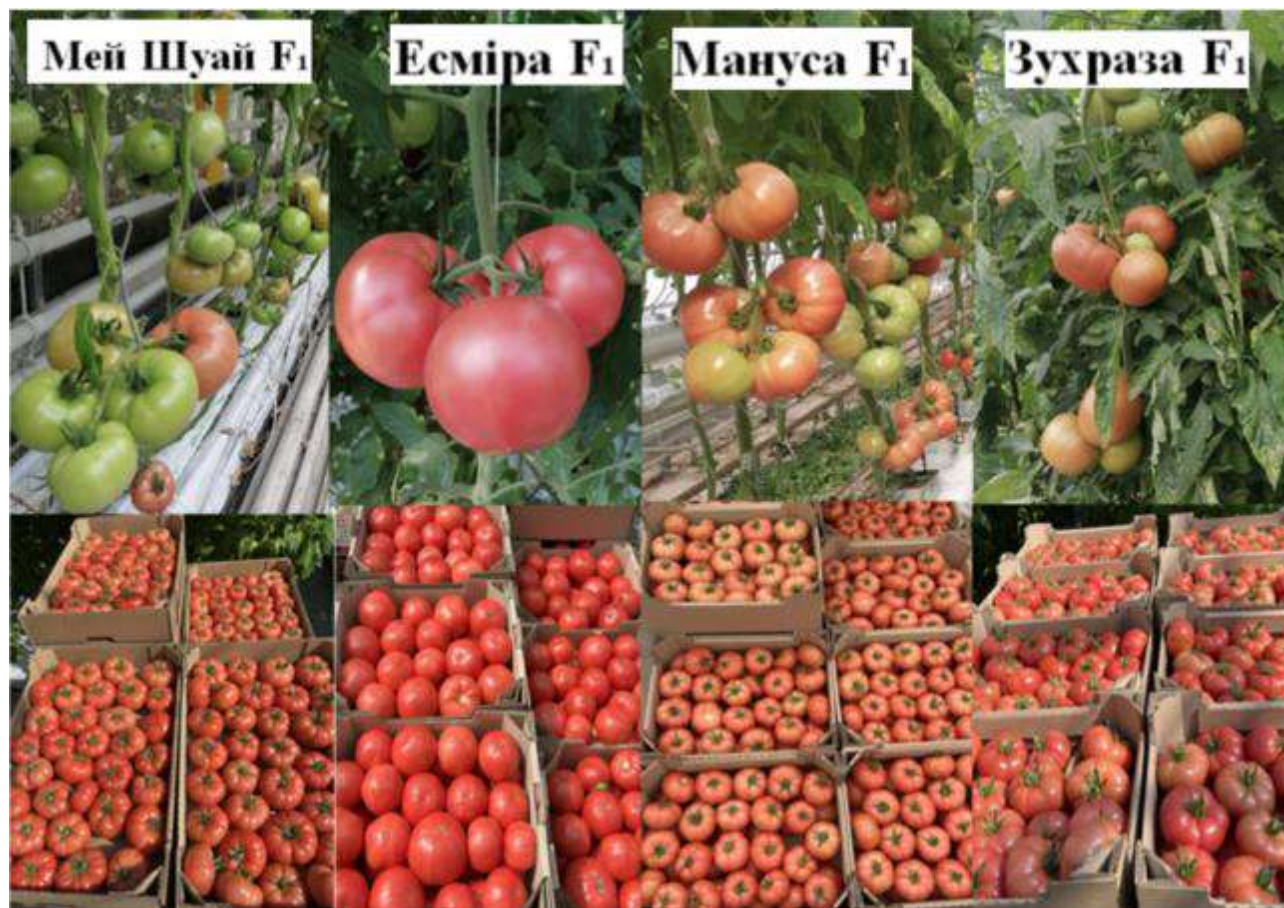
Рис. 1. Наочне зображення досліджуваних гібридів під час проведення досліджень

Оптимальна густина стояння рослин становить 2,5–3,0 рослини на м 2 . Для досягнення максимальної урожайності потребують застосування інтенсивної технології вирощування з використанням шпалер, регулярного пасинкування, нормування навантаження плодами та збалансованого мінерального живлення [6,13].