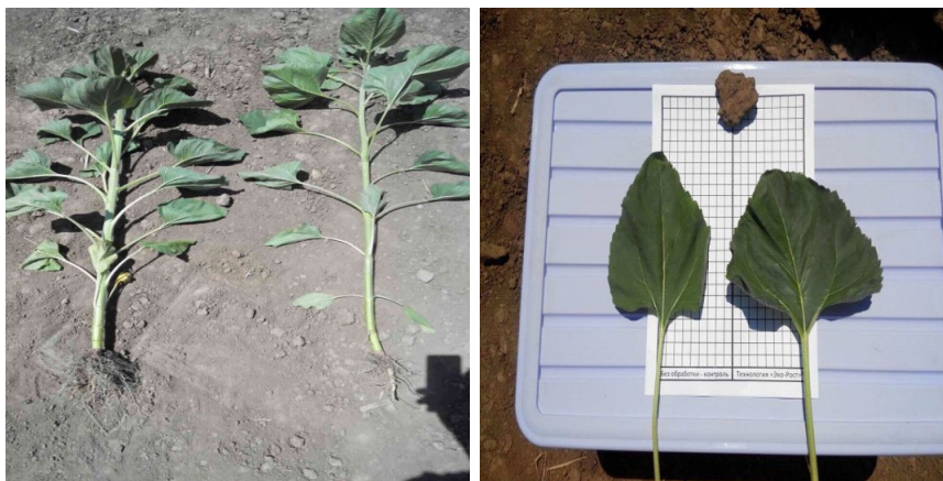
а б Рис. 1. Загальний вигляд рослин (а) й архітектоніка листової пластинки (б) соняшнику гібриду PR64F66 за інтенсивної та органічної технології вирощування

диційної технології вирощування, в середньому, на 4,5 см. Загальний габітус рослин соняшнику на фоні інтенсивної технології вирощування характеризувався збільшенням показника середньої довжини міжвузлів, зменшенням діаметру стебла, видовженими та стоншеними листовими пластинками з меншою інтенсивністю забарвлення через менший вміст у них зеленого пігменту (рис. 1, табл. 2).